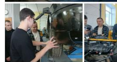
Ученики школы получили опыт замещения навыков электронной диагностики а... профориентационному проекту "Билет