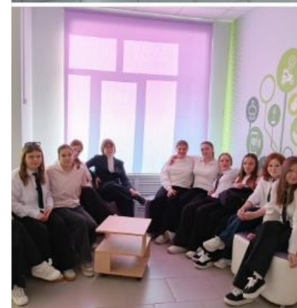
В рамках проекта "Билет в будущее" ученики 8 класса попробовали себя в роли поваров и кондитеров.