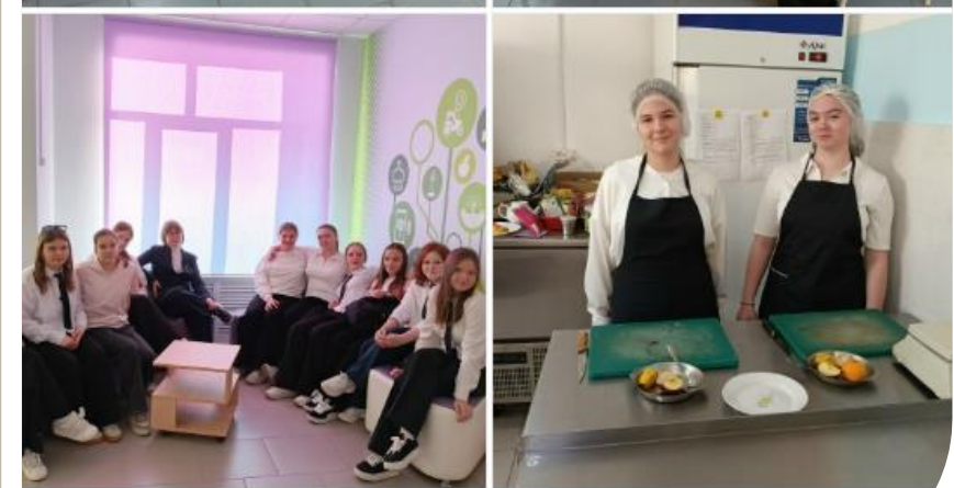
В рамках проекта "Билет в будущее" ученики 8 класса попробовали себя в роли поваров и кондитеров.

Конкурс технического творчества и робототехники, посвящённый 80-летию со дня Победы в Великой Отечественной войне – 6 победителей.