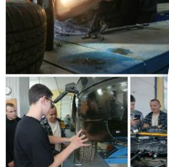
Ученики школы получили опыт э навыки электронной диагностики профориентационному проекту